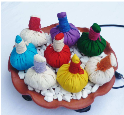
Aquecedor de pindas não incluso